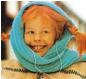
Pippi Langkous, moeilijk opvoedbaar of zelfredzaam?

We brengen samen met u in kaart hoe de zorgstructuur op uw school werkt en in hoeverre uw school al handelingsgericht werkt en wat de sterke en de zwakke punten zijn van uw school. Daarvoor gebruiken we een quickscan, doen dossieronderzoek en soms houden we een teamenquête.