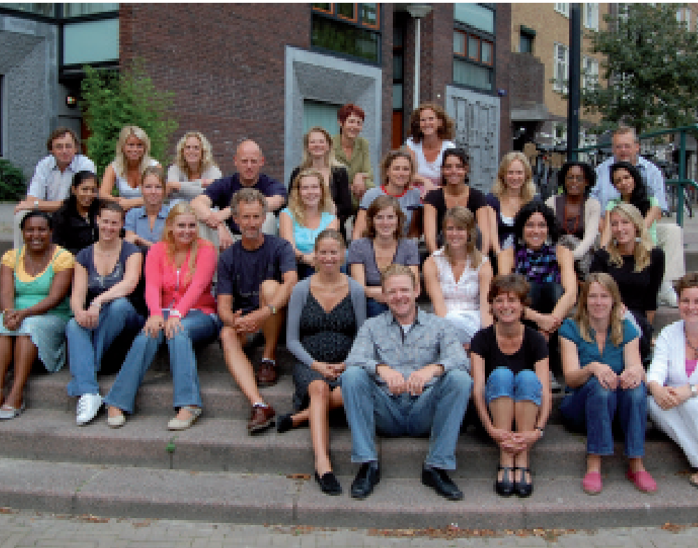
Teamfoto 2009–2010 St. Janschool

scenario's zo uitgewerkt dat elke leerkracht er op een eenvoudige manier mee kan werken.' Vanuit deze (standaard)handelings-scenario's maakt de leerkracht samen met de intern begeleider een leerling specifiek handelingsplan waarin de concrete aanpak wordt beschreven.